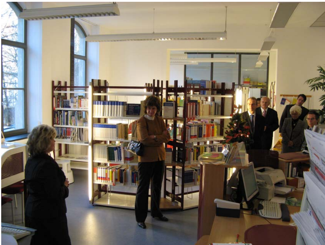
Besuch der Sächsischen Staatsministerin für Wissenschaft und Kunst, Frau Dr. Eva-Maria Stange, an unserer Akademie (hier in der Bibliothek)

Dies eröffnet gute Berufschancen mit entsprechenden Karrieremöglichkeiten. Studierende können zudem auch bereits während des Studiums zielgerichtet in die Projektarbeit beim Praxisbetrieb einbezogen werden, so dass die Praxisbetriebe als Arbeitgeber auch während der Studienzeit wertvolle Impulse junger, motivierter Studierender erhalten können. Die Studierenden profitieren wiederum von dem reichhaltigen Erfahrungsschatz der Mitarbeiter der Praxisbetriebe. Das duale Studium leistet daher einen wertvollen Beitrag zur Ausbildung von Nachwuchsführungskräften in allen Teilen einer Organisation und ist daher aus Sicht der Praxis optimal geeignet, um sich auf die zukünftigen Herausforderungen auf dem Arbeitsmarkt einzustellen. Dies ist gerade im Gesundheits- und Sozialmanagement dringend erforderlich.“