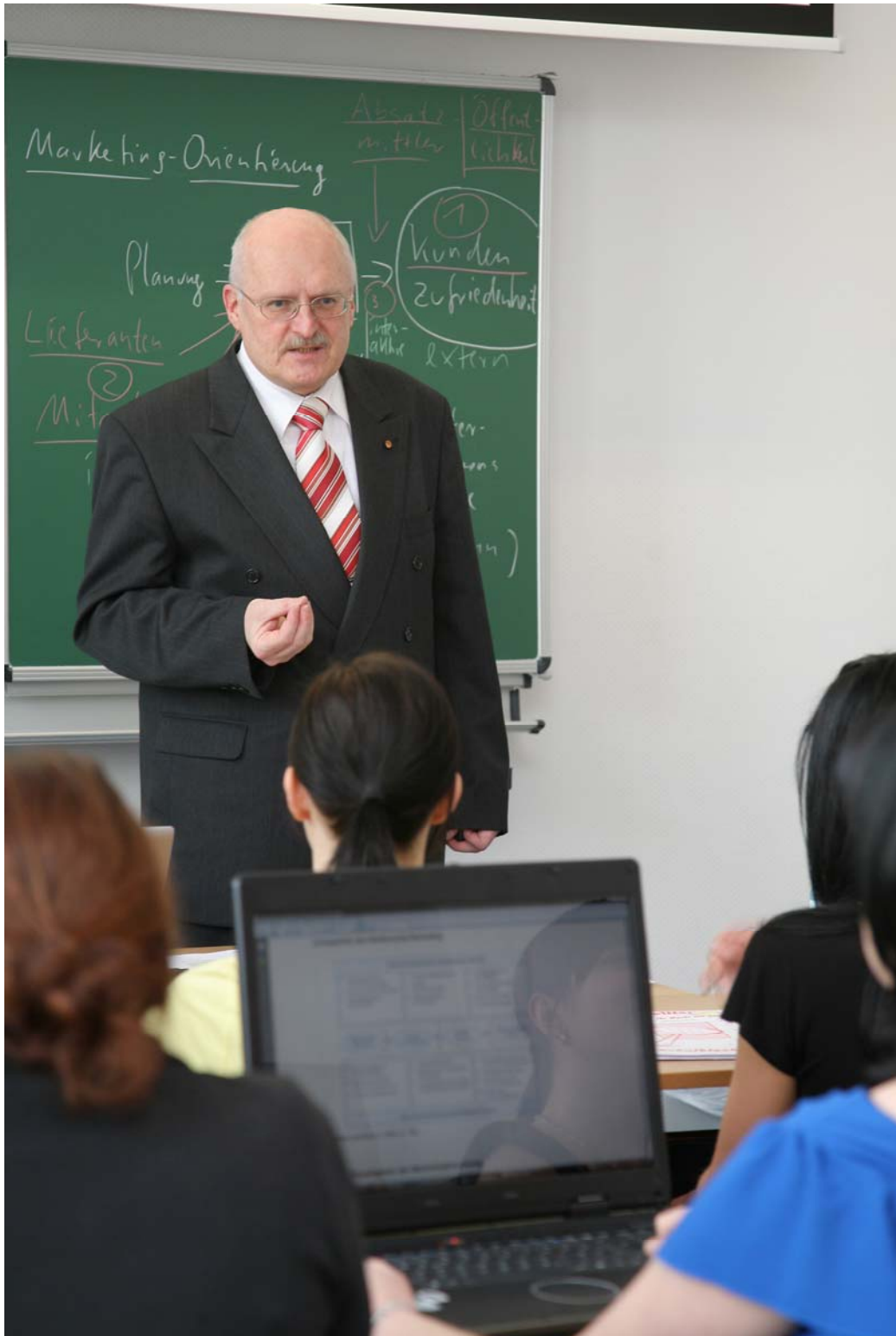
Akademische Lehre an der Studienakademie

Mit der Hans-Weinberger-Akademie der Arbeiterwohlfahrt e.V. München wurde beispielsweise die Weiterbildung zum Qualitätsbeauftragten im Sozial- und Gesundheitswesen ins Auge gefaßt und bestehende Anrechnungsmöglichkeiten geprüft (52 von 160 Präsenzeinheiten). Aber auch in den Bereichen Case Management und Sozialmanagement zeichnet sich eine Zusammenarbeit ab.