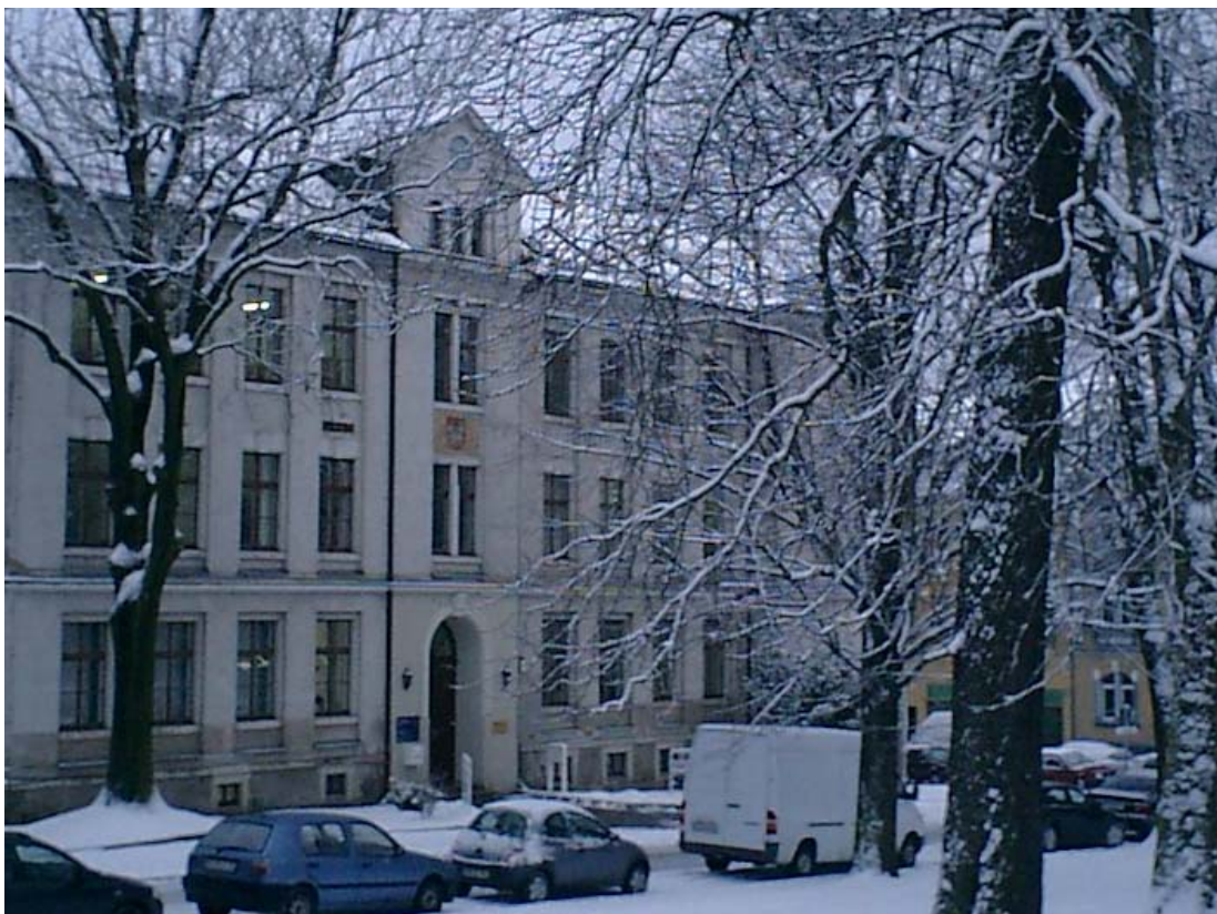
Früherer Standort der Staatlichen Studienakademie Plauen