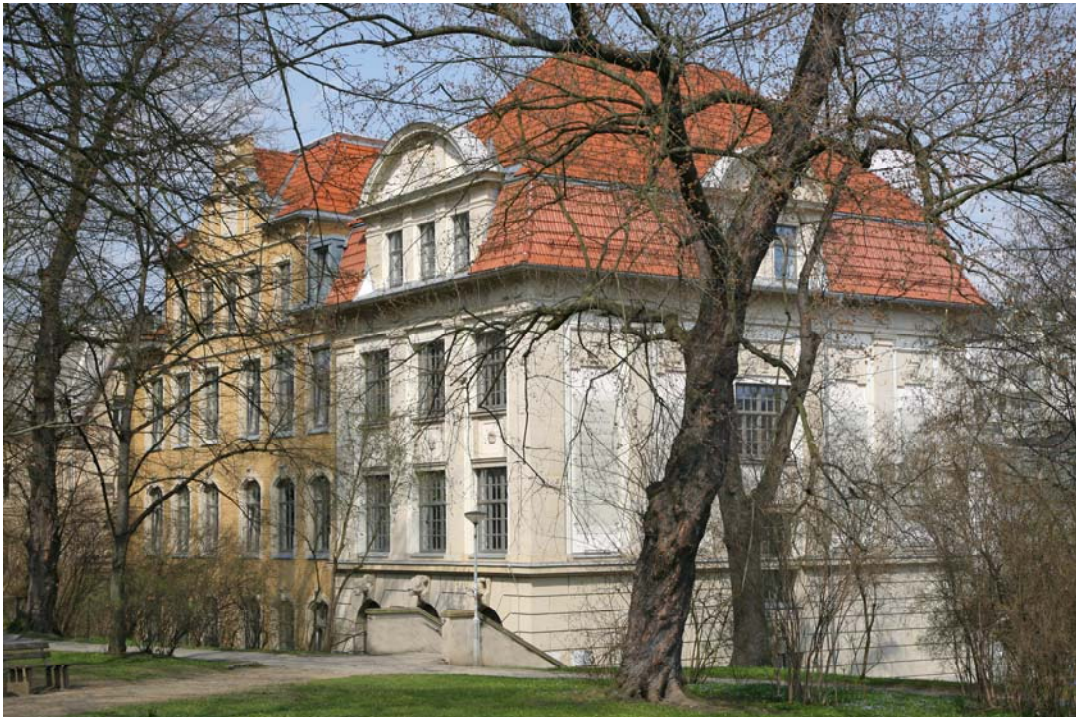
Klaufner-Bau der Staatlichen Studienakademie Plauen vom Rathaus aus betrachtet

Von den Dozentinnen und Dozenten kommen wie von den Praxispartnern und den Studierenden immer wieder Anregungen zur Weiterentwicklung des Studienganges. Die Ideen finden gerade jetzt im Jubiläumsjahr besondere Beachtung; so hat etwa der Gedanke, zusammen mit anderen Disziplinen ein Kompetenzzentrum für Gesundheit zu entwickeln, einen gewissen Charme für die zukünftige Profilierung der BA Plauen. Die BA Plauen versteht sich als eine „institutio semper reformanda“, die beim Erreichten nicht stehen bleiben will.“