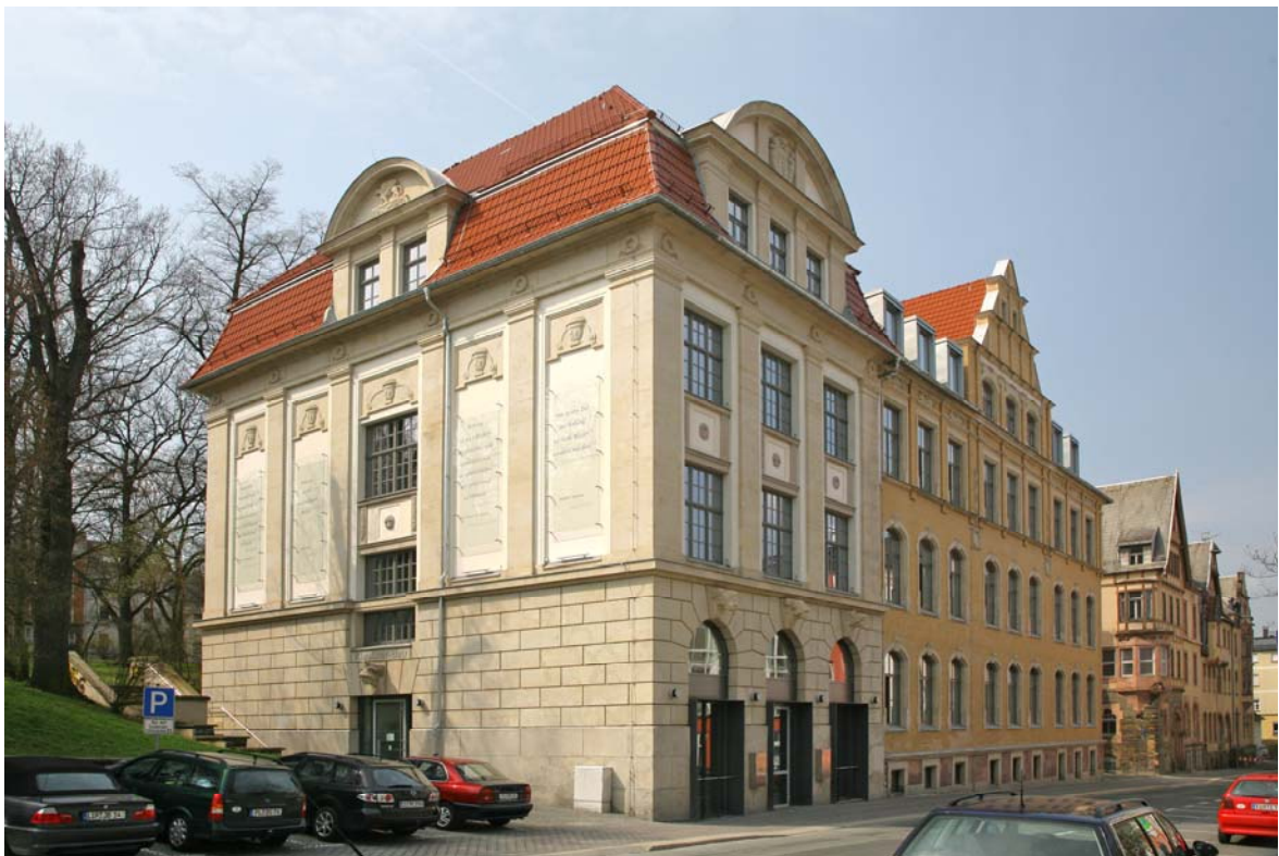
Heutiger Standort der Staatlichen Studienakademie Plauen (Klaußner-Bau)

Durch Umfirmierung des Studienganges mit Zustimmung aller relevanten Gremien wurde im Zuge der Weiterentwicklung deutlich gemacht, dass Absolvent(en/innen) im Rahmen ihres Studiums für das Gesamtspektrum des Wirtschaftszweiges, also für den Gesundheits- und für den Sozialsektor, spezifische berufsbefähigende Kompetenzen erlangen.