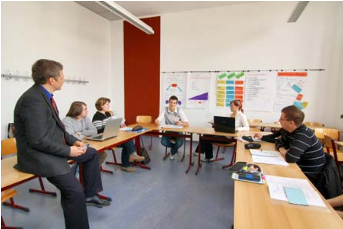
Gruppendiskussion als aktivierende Lehr-/Lernform