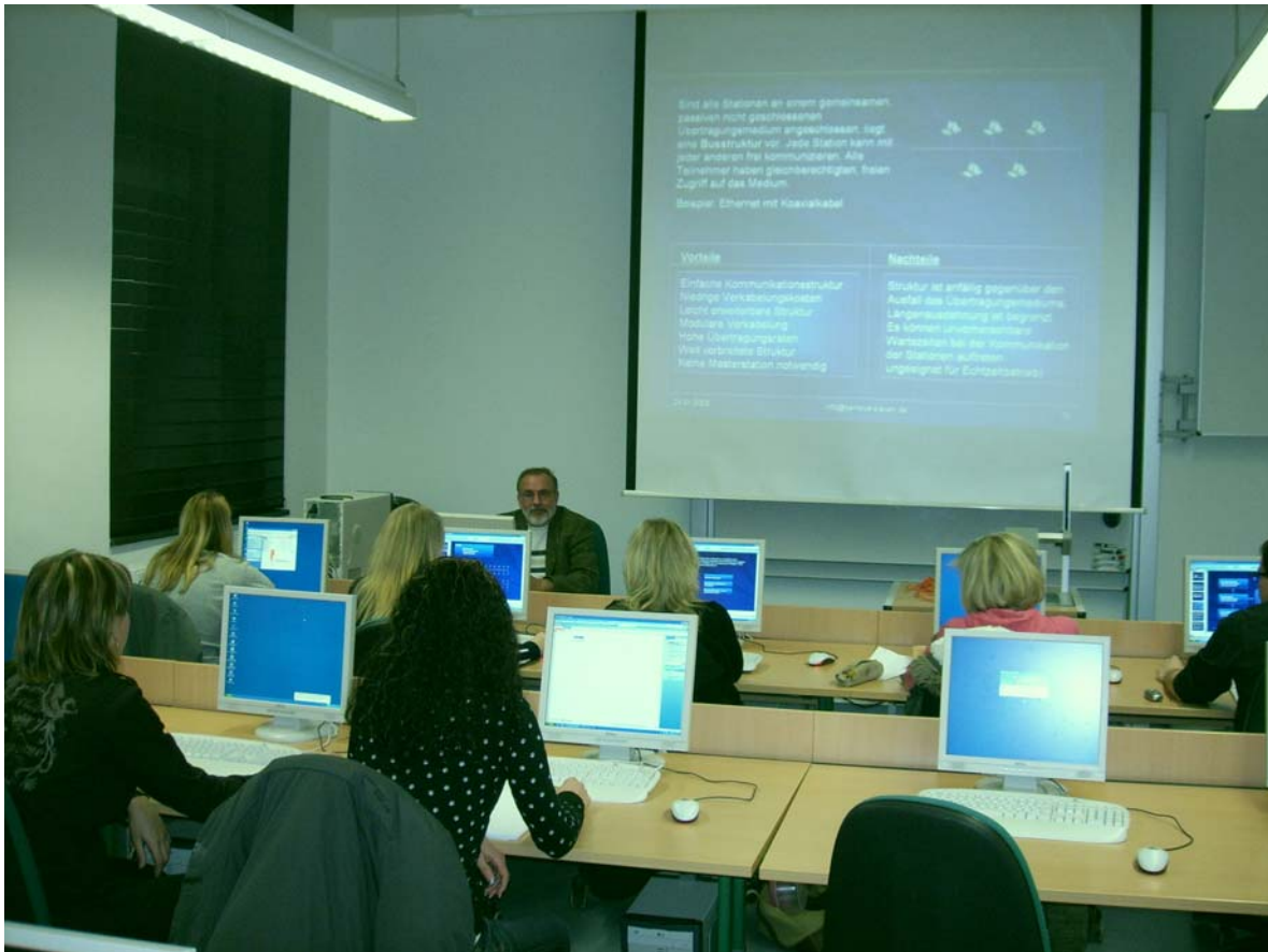
Unterricht im PC-Kabinett

einer vollen Stelle für die Verwaltungsmitarbeiterin erscheint keineswegs üppig. Immerhin ist zu bedenken, dass sich auf der Grundlage einer zusätzlich erhaltenen befristeten Dozentenstelle keine langfristige Planung realisieren lässt, sofern man die Verantwortung den Studierenden, den Praxispartnern, dem Staat und der Gesellschaft gegenüber ernst nimmt.